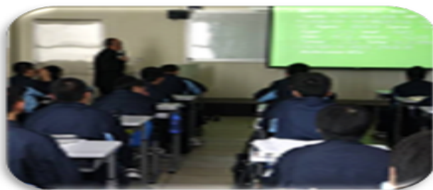
海域執法規範要領研討