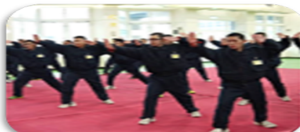
綜合逮捕及短警棍訓練